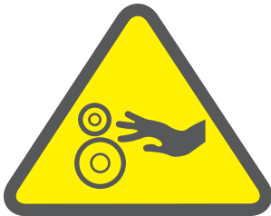
ATENCIÓN RIESGO DE ATRAPAMIENTO