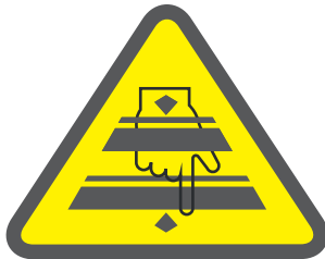
RIESGO DE CORTE ATENCIÓN LAS MANOS