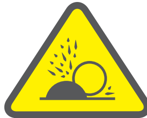
PELIGRO PROTECCIÓN DE PARTICULAS